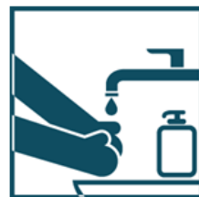
Чаще мойте руки