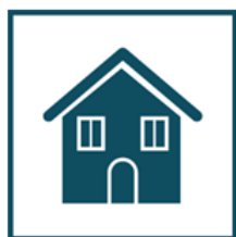
Оставайтесь дома в период массовых заболеваний