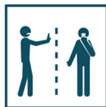
Ограничьте контакты с заболевшими людьми