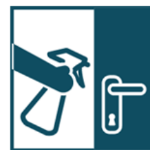
Влажная уборка дома ежедневно