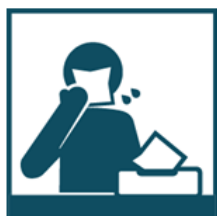
Пользуйтесь одноразовой бумажной салфеткой при чихании, кашле, насморке

Соблюдение следующих гигиенических правил позволит существенно снизить риск заражения или дальнейшего распространения гриппа, коронавирусной инфекции и других