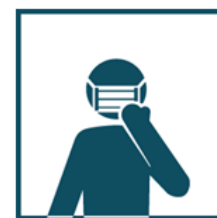
Пользуйтесь одноразовой маской