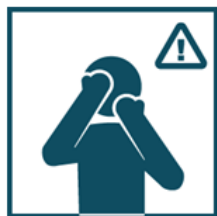
Не прикасайтесь к лицу немытыми руками